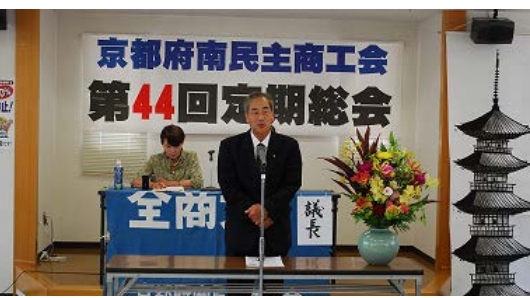
南民主商工会定期総会(6/15)

消費増税への対応として、市民税非課税世帯や子育て世帯に対し、臨時の給付金が支給されます。1万円または1万5千円で、消費税増税は続くのに、支給は一回切りです。来年の10%への増税反対の声を抑えようとのネライも見え隠れしますが、それでも、「消費税は低所得世帯ほど重税になる」との国民の批判に押された「成果」でもあります。