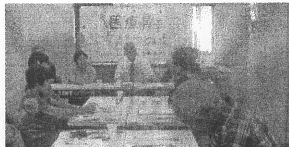
小集会開く(9/20、塔南学区)国保の現状などについて訴えました。

23日、宝が池公園にて恒例の「京都まつり」が開かれました。ご参加の皆さん、ありがとうございました。