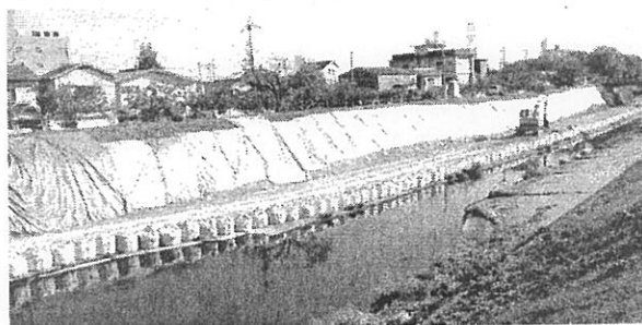
写真上は昨秋台風時、堤防外側から漏水、下は現在改修工事中の堤防内側

た。今回、その一部が実現しました。引き続き、未着手の箇所についても改善を要求しています。桂川堤防の漏水の改善について申し入れ、一部が改善されています。