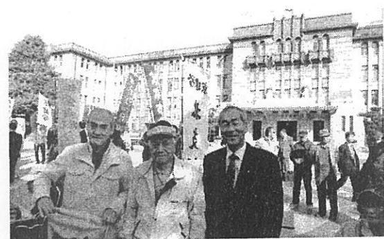
11/7、京建労の皆さんとともに

た。今回、その一部が実現しました。引き続き、未着手の箇所についても改善を要求しています。桂川堤防の漏水の改善について申し入れ、一部が改善されています。