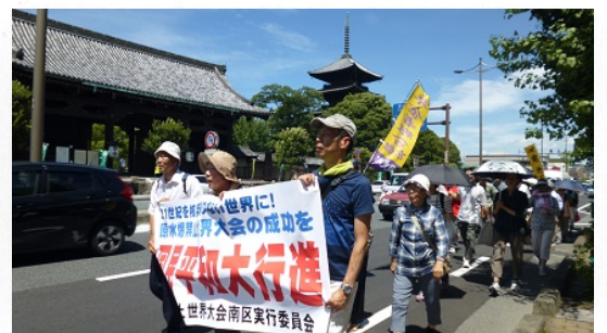
核兵器廃絶めざし平和行進 (7 / 2)