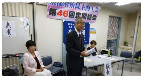
南民主商工会総会で挨拶 (6 / 19)

た。同規模か？ ● 分らない。 ● 高速道路廃止と言いな ● 高速道路廃止と言いな ● 高速道路廃止と言いな