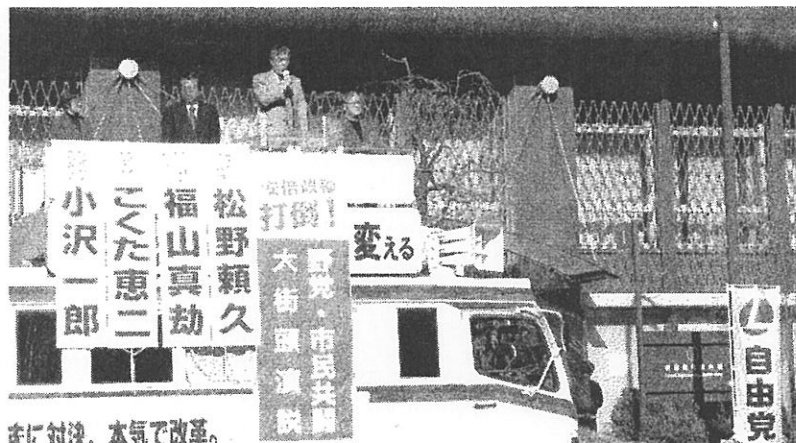
争いに対決、本気で改革。

その為にも、日本共産党を大きくして下さい。力を合わせて暮らしと政治を変えましょう。どうぞ宜しくお願い申し上げます。皆様方の、ますますのご多幸とご健勝を、心よりお祈り申し上げます。