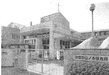
市立山ノ本保育所（上鳥羽）

の廃止・民間移管が矢継ぎ早に進められています。児童福祉センター・心の健康増進センター・障害者リハビリテーション・シヨンセンター・施設のリノベーション・施設の合築一本化や中央保護所廃止の方針も打ち出されています。水道局営業所（写真左は国道十条上る）やまち美化事務所、消防