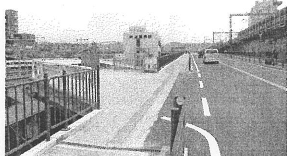
高倉跨線橋(竹田街道)の整備が実現

◎福祉施設入所希望ですが、国も市も、最近「地域・在宅」ばかりを強調しています。地域で暮らす意義は分かりませんが、政府は予算削減が本音。施設にも独自の意義があると強調し交渉中。 ◎借金や、婚姻・離婚のご相談、遺産相続等。 ◎家探し。国や市は、もつと公営住宅を拡充すべきです。「住まいは人権」。歴代自民党政府は「持ち家主義」「自身の甲斐性で」。おかしい。 ◎「民泊」対策。 ◎入院費用の支払い。療養の長期化が予測され、退院後の行き先。