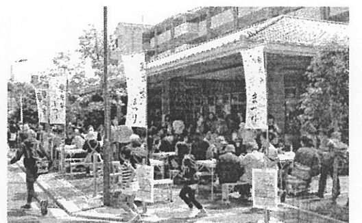
「東九条春まつり」を見学(4/22)