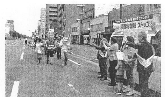
メーデー参加者を激励(5/1)