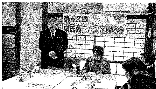
南民商婦人部総会(12/17)