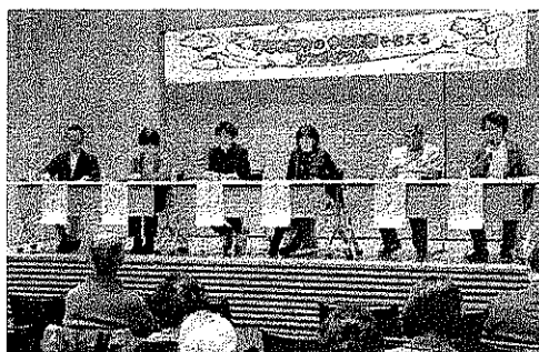
子どもシンポジウム(12/3)

この一年間、あなたか「支持」を頂き、本当に有り難うございました。心より御礼申し上げます。来年も、どうぞよろしくお願い致します。