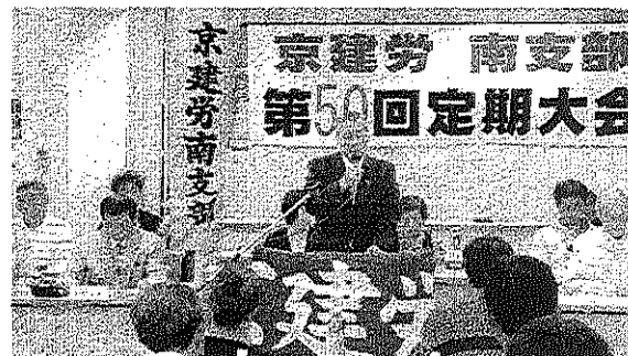
京建労南支部定期大会で挨拶 (4/22)