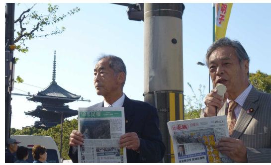
こくた議員と国政市政報告(10/21)

井上議員は、「有権者と議会への公約違反。民主主義の根本が問われる。両方とも廃止撤回すべき」と追及、市は「高速廃止方針を変えたくはない」となると居直っています。