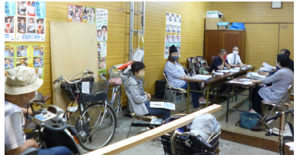
南民主商工会の給付金申込み勉強会

10万円が実現したものです。4月27日現在の住民票のある住所に申請書が送られます。家族の名前など