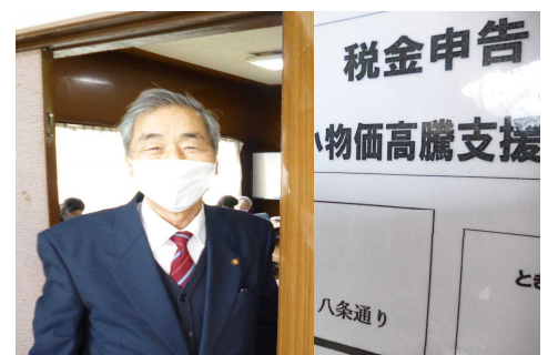
税金相談会 (3月4日) にて

◎ ハトのフンを何とかしてほしい。 ◎ 烏丸通り札ノ辻交差点の道の凸凹の改修は、来年度予算で着手予定です。 ◎ 鴨川の堤防の階段に手すりを付けてほしい。 ◎ 下水マスのふたがガタガタしている。 ◎ 「憲法守れ」の署名をしたので、用紙を届けて欲しい。 ◎ マンホールのふたがガタガタしている。 ◎ 母が老人ホームに入っているが、そこで選挙はできるんでしょうか？ ◎ 議会の合間に、生活保護申請に同行。 ◎ 市の物価高対策支援金の紹介をしてもらったので申請、このほど一息ついた。続きをお願いいたします。